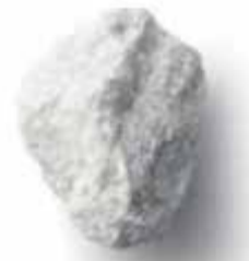
炭酸カルシウム (石灰石)

主原料となる石灰石は世界に非常に豊富に存在し、 日本においても自給率 100%の安価に入手可能な鉱物資源